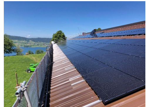
Bau Anlage Oberschwendi Alosen

Die finanzielle Situation lässt es zu, weitere, auch grosse Anlagen zu erstellen. Interessierte Dachbesitzer dürfen sich gerne bei uns melden.