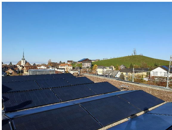
Blick von der Anlage Luegeten nach Menzingen

Wir gehen zuversichtlich in die Zukunft und freuen uns schon jetzt auf das 10-jährige Jubiläum im 2024. Und wer weiss, vielleicht erreichen wir bis dahin das Ziel von einer Million Kilowattstunden produzierter Energie pro Jahr.