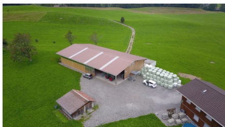
Emma und Sven Iten Hintermeisbüel, Unterägeri ca. 31'000 kWh/Jahr